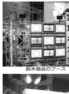
鈴木商会のブース

【札幌】道内グループ11社は、12月に移転総合力高める。道内グループ11社は、12月に移転総合力高める。道内グループ11社は、12月に移転総合力高める。