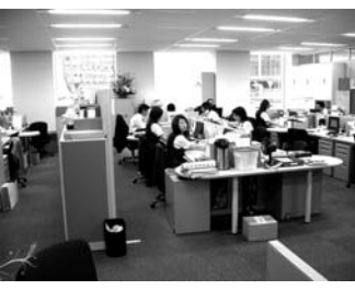
新オフィスで快適業務

【札幌】JFE商事グループ各社は、新オフィスで快適業務。JFE商事グループ各社は、新オフィスで快適業務。JFE商事グループ各社は、新オフィスで快適業務。