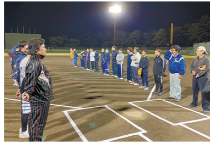
健康増進の一環として開催している野球大会

今年2月には健康管理に役立つスマートフォンアプリ「みんなでチャレンジ」を導入しました。約130人の全社員が▽歩数▽運動▽栄養▽睡眠▽禁煙の中から一つを選んで、5人1組のチームとなります。目標を共有し仲間と励まし合ったり、他のチームに現状報告し競い合ったりすることで、モチベーションが高まり、継続的な活動につながっています。普段、なかなか会うことのない他部署の社員と交流する機会にもなっています。