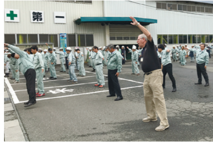
社員総出で毎朝実施しているラジオ体操

4月からはメンタルヘルス対策として、上司と部下が1対1で話し合う機会を設ける「1オン1ミーティング」を実施。信頼関係を築き、本音で話し合える環境づくりを目指しています。